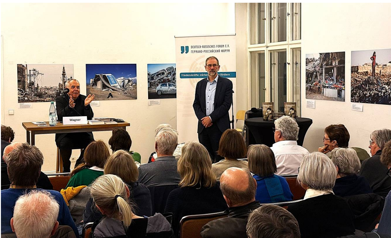
Rund 60 Gäste folgten der Einladung von GEG und DRF zur Lesung in der Sprechsaal